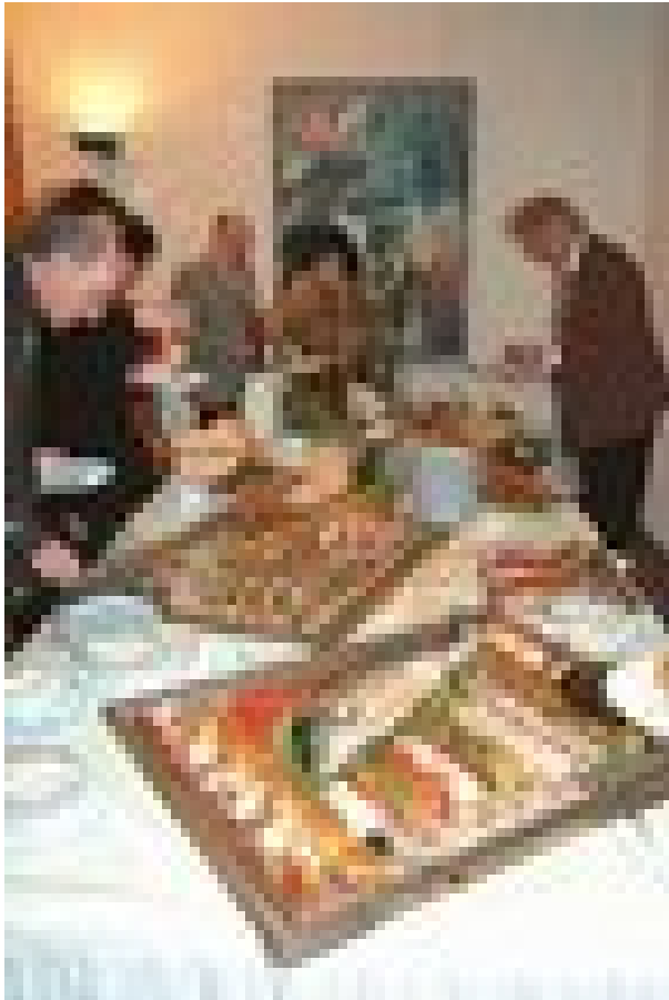
Stärken am üppigen Büfett.

beiden Tanzpaare der Tanzschule Wieland Still aus Heidenheim, die in Formation Einiges für das Auge zu bieten hatten. Latin-Rhythmen vom Cha-Cha, Rumba, Salsa bis hin zu Disco-Fox und Rock'n'Roll waren da zu bestaunen. Eine Verlosung stand am Ende des Programms (wir werden gesondert darüber berichten) und eine Silvesternacht ging mit einem langen Tanzprogramm in einen Neujahrsmorgen über. Begeisterte Gäste und Besucher ließen diese erste Silvesterveranstaltung zu einem gelungenen Ereignis musikalischer, kulinarischer und auch gesellschaftlicher Art werden.